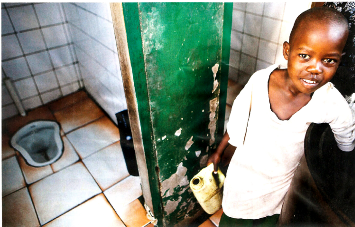
ØKOURINAL: Dårlige sanitærforhold er en av hovedårsakene til spredning av sykdommer i slumområder. I Uganda samarbeidet designere blant annet med den lokale plastprodusenten, for å finne ut hvordan urin kan samles og brukes som naturgjødsel.