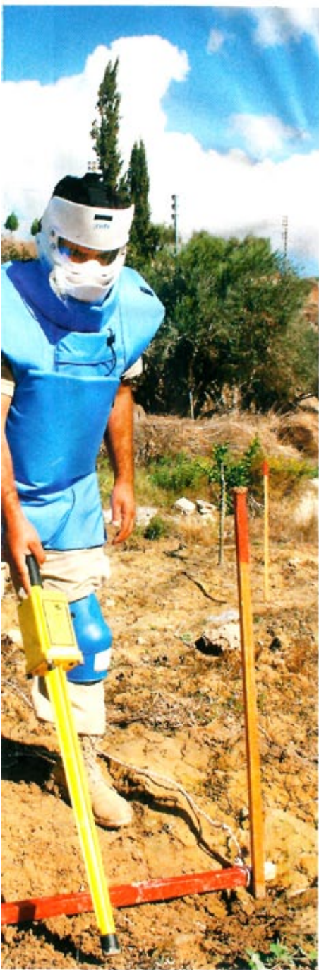
at minerydderutstyret som ble brukt i lettere og kjøligere i bruk.