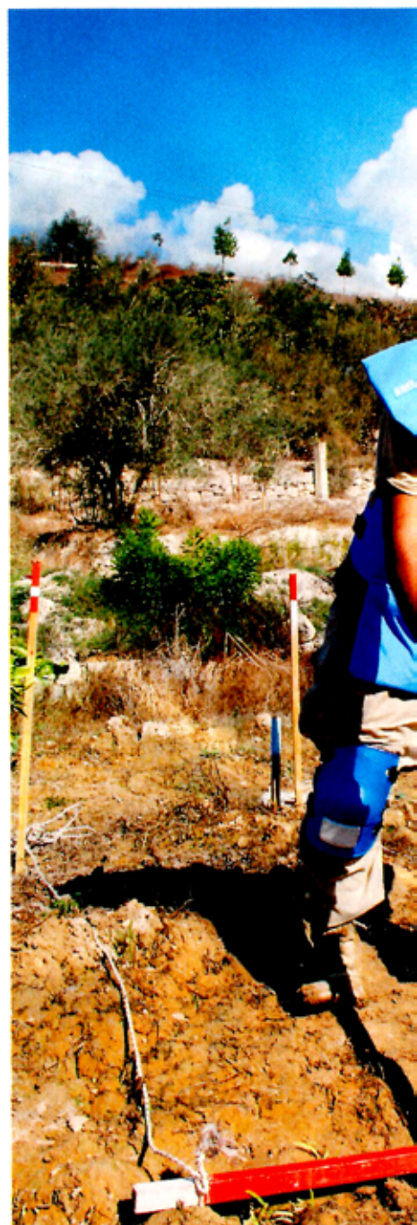
LETTERE UTSTYR: Norske designere fant ut Mosambik var tungt og varmt. Den nye er

ROBUSTE RULLESTOLER. I Guatemala fant designerne en ny måte å produsere og tilpasse rullestoler på.