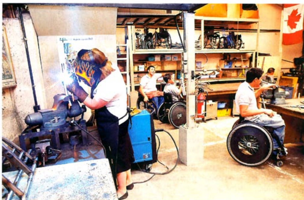
TILPASSET FORHOLDENE: Rullestolene utviklet i Uganda er blant annet tilpasset ulendt terreng. Ideer og kunnskap fra rullestolbrukere lokalt var en viktig brikke i forarbeidet.

av brede sykkelhjul er for eksempel nødvendig, fordi rullestolbrukerne er avhengige av å bevege seg på humpe veier uten asfalt.