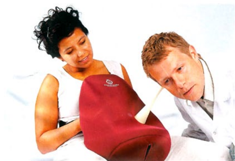
ALLE FOTO: DESIGN UTEN GRENSEINØRSK FORM